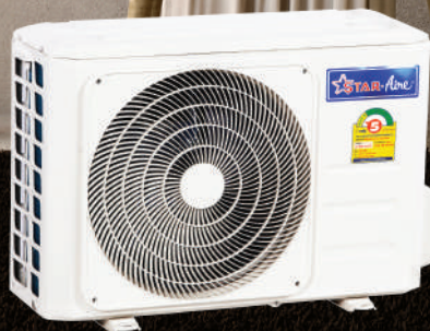
MODEL : CM-A, CM