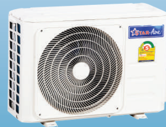
MODEL : CM-A,CM