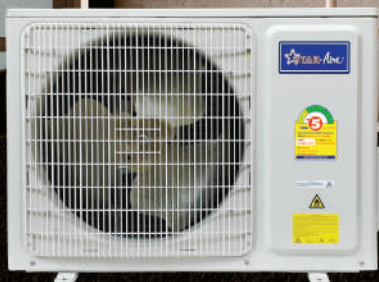
MODEL : CE-A