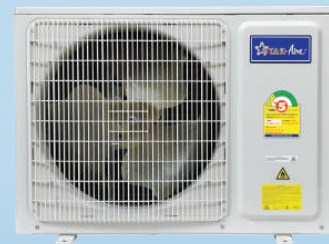
MODEL : CE-A

มีท่อน้ำยาสำเร็จรูปยาว 4 เมตรแถมมาให้กับเครื่อง