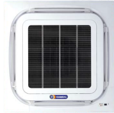
Cassette type CD,CSD