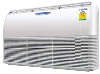
Ceiling type EER,ER