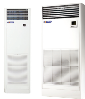
Floor standing PB,PF